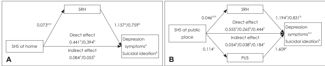
Fig. 2. Mediation models of SHS, SRH, PUS, depressive symptoms and suicidal ideation in non-smokers. (A) Represents the potential mediating effect of SRH on the association between SHS at home and depressive symptoms (a), suicidal ideation (b). (B) Represents the potential mediating effect of SRH (a, b) and PUS (c) on the association between SHS at public place and depressive symptoms (a, c), suicidal ideation (b). The effects of each variable relationship are shown alongside their respective arrows. SHS : Secondhand smoke, SRH : Self-rated health, PUS : Perceived usual stress.

도파민 D1과 D2 수용체를 증가시키고, 51) GABA B2 수용체, 도파민 transporter mRNA, 도파민 수용체의 발현을 변화시키는 것을 확인하였다. 52) 다른 동물 실험에서는 니코틴이 장기적으로 도파민 수송의 불균형을 유발하며, 53) 니코틴 노출이 부정적인 감정을 유발하고 운동성을 감소시키는 것을 확인하였다. 54) 세번째로 간접흡연의 노출이 만성적인 염증반응을 통해 우울증상을 일으킬 수 있다. 흡연은 만성적인 염증과 연관되어 있으며, 55)56) 최근 연구들은 우울증에서 염증성 사이토카인이 과도하게 증가되어 있으며, 이러한 만성적인 염증이 우울증의 병인에 기여할 가능성을 제시하고 있다. 57-59) 특히 염증성 사이토카인은 indolamine 2,3-dioxygenase에 작용하여 세로토닌 신경전달체계에 영향을 미침으로서 우울증상을 유발할 수 있다. 60)